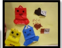
♪お折り紙カレンダー